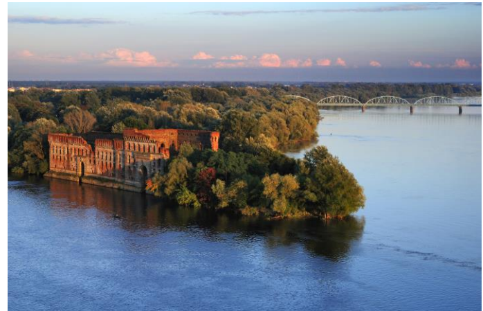
Ruiny zabytkowego spichlerza u ujścia Narwi do Wisły