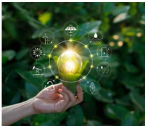
Dostosowanie do zmian klimatu