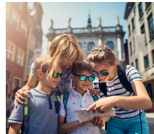
Kultura i turystyka