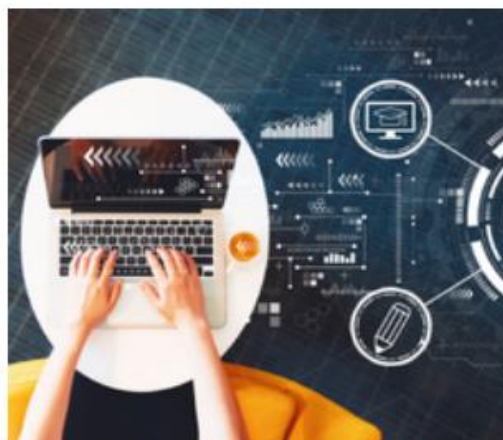
Edukacja i podnoszenie kompetencji na rynku pracy