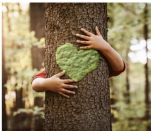
Zachowanie i ochrona środowiska