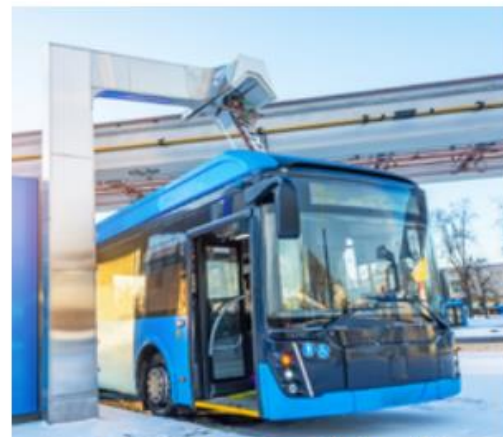
Transport i mobilność